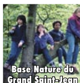
Base Nature du Grand Saint-Jean