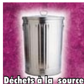
Déchets à la source

Nous avons pu organiser trois groupes de travail thématiques. Partant d'une part de l'état des lieux du territoire grâce au diagnostic élaboré par l'Agence d'Urbanisme du Pays d'Aix, d'autre part de la connaissance que les associations ont des problèmes d'environnement et de nuisances, nous avons pu élaborer un livre blanc.